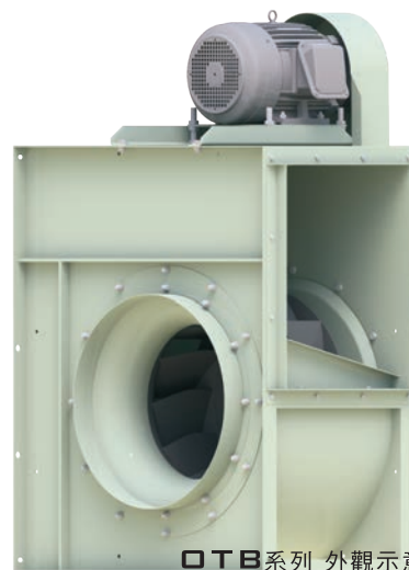
OTB系列 外觀示意圖 OTB SERIES IMAGE