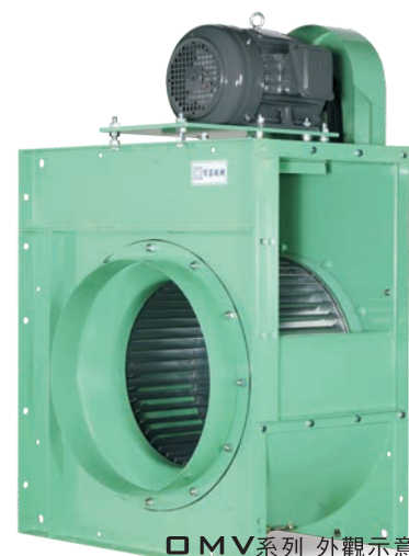
OMV系列 外觀示意圖 OMV SERIES IMAGE