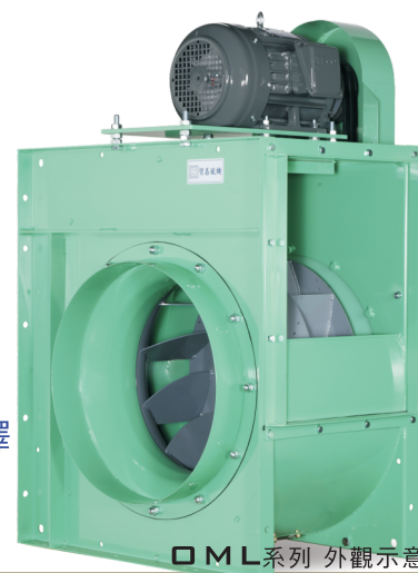
OML系列 外觀示意圖 OML SERIES IMAGE