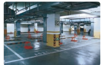
大樓/地下室/空調換氣