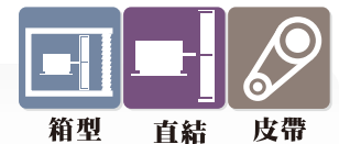
箱型 直結 皮帶