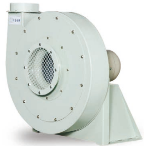
外觀示意圖 SERIES IMAGE