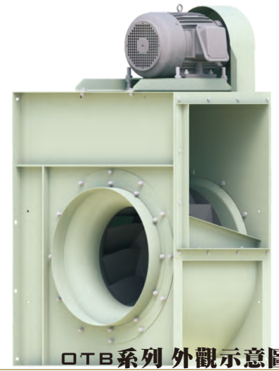
OTB系列外觀示意圖 OTB SERIES IMAGE