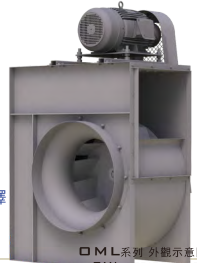
O ML系列 外觀示意圖 O ML SERIES IMAGE