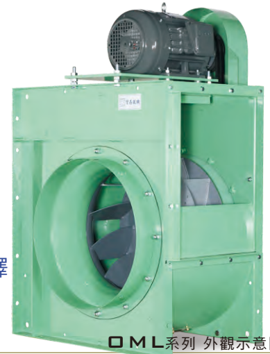
OML系列 外觀示意圖 OML SERIES IMAGE