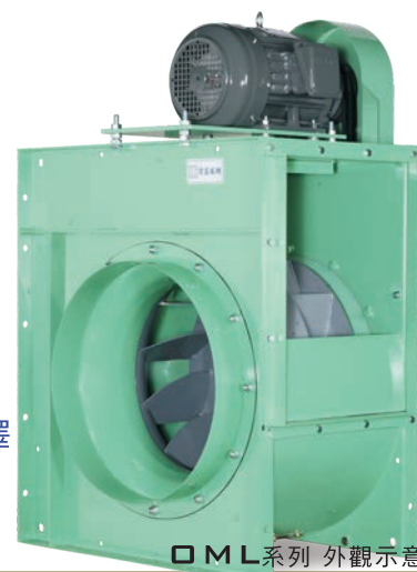
OML系列 外觀示意圖 OML SERIES IMAGE