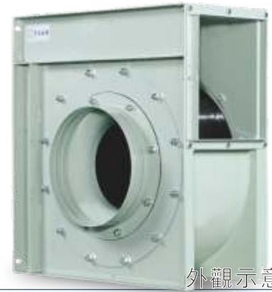
外觀示意圖 Series Image