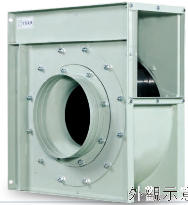
外觀示意圖 Series image