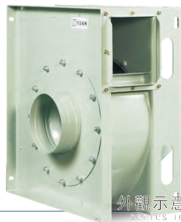
外觀示意圖 Series image