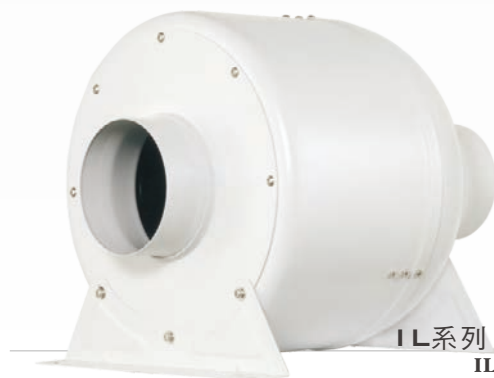
IL系列 外觀示意圖 IL series image