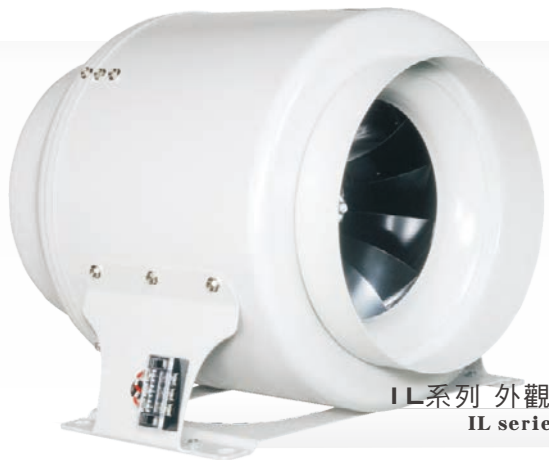
IL系列 外觀示意圖 IL series image